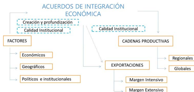
Gráfico 1: Acuerdos de Integración Económica

La fragmentación y relocalización de los procesos productivos se ha generalizado durante los últimos años en numerosos países. Tienen la ventaja de que las distintas etapas de producción pueden estar localizadas en países especializados en la producción de insumos o bienes intermedios necesarios para la producción de los bienes finales. Este proceso permite aumentar la variedad de productos y reducir los costos de producción de las empresas y, en consecuencia, disminuir el precio de los bienes finales. Por